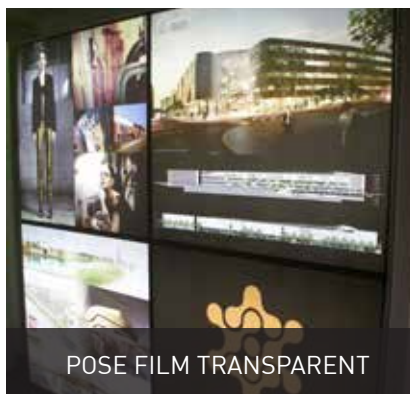
POSE FILM TRANSPARENT