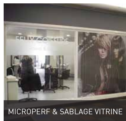
MICROPERF & SABLAGE VITRINE