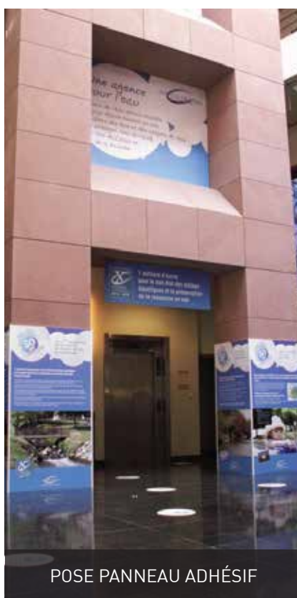
POSE PANNEAU ADHÉSIF