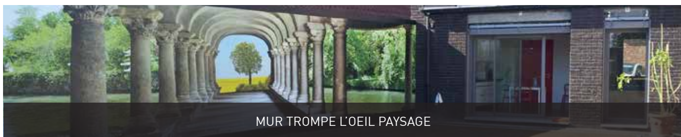
MUR TROMPE L'OEIL PAYSAGE