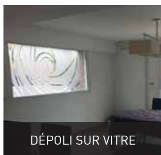
DÉPOLI SUR VITRE