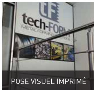
POSE VISUEL IMPRIMÉ