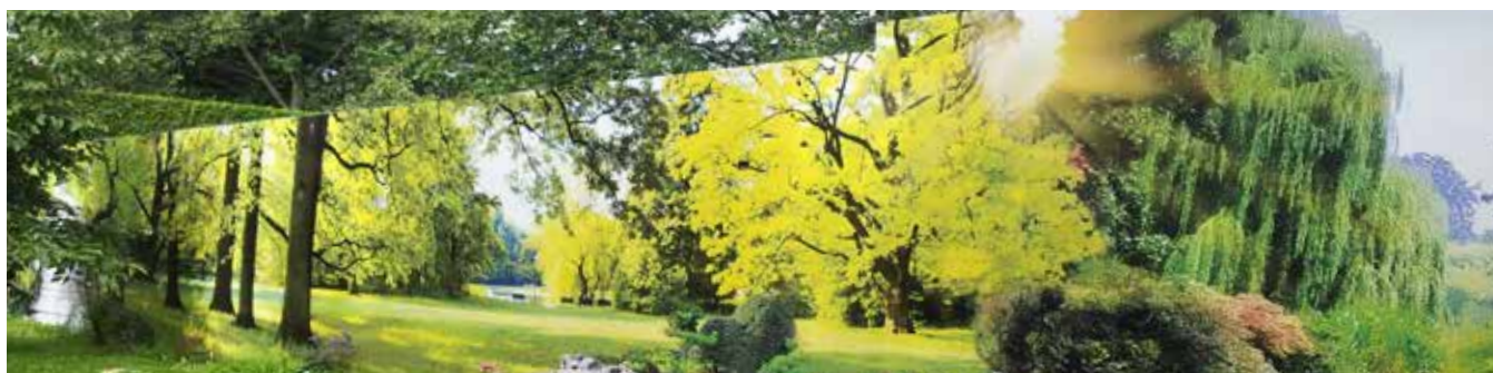
TROMPE L'OEIL EN IMPRESSION NUMÉRIQUE SUR ADHÉSIF