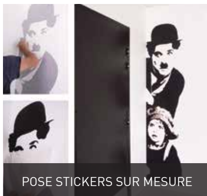
POSE STICKERS SUR MESURE