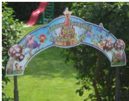
DESIGN & FABRICATION PANNEAU