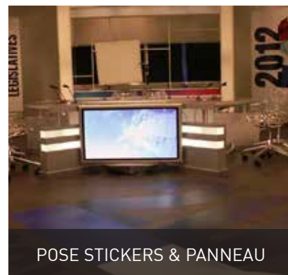
POSE STICKERS & PANNEAU