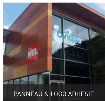
PANNEAU & LOGO ADHÉSIF